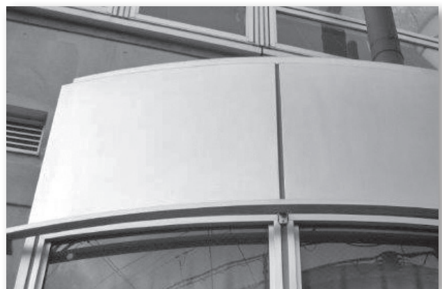
専用洗浄剤で汚染ファクターを除去し、表面保護処理を行うことで劣化した電着塗膜層を修復！美観は見違えるように回復し耐候性も向上！【結果】問題解決！

アルミパネルのメンテナンスはできるかぎり早期に、定期的に行うことをおすすめします。手遅れになる前に、東京外装メンテナンス協同組合に相談してくださいね！